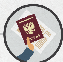
Предъявить паспорт и направление