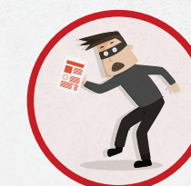
Кто-то пытается вынести незаполненный бюллетень с участка