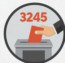
Сообщить число досрочно проголосовавших избирателей, опустить их бюллетени в ящик для голосования