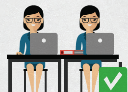
Места для членов комиссии