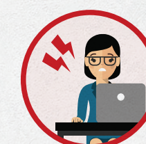
Кто-то пытается давить на членов комиссии или подкупать избирателей