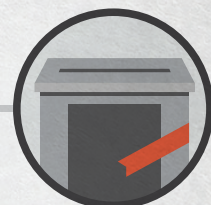
Предъявить и опечатать пустые ящики для голосования