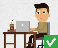
Место для наблюдателя, откуда открывается хороший обзор всего помещения