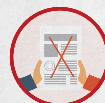
Избирателям выдают бюллетени неустановленной формы