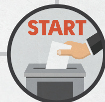
Объявить об открытии УИК