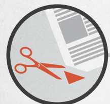
Погасить неиспользованные открепительные удостоверения (отрезают нижний левый угол)