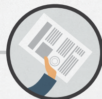
Предъявить списки избирателей