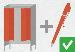
Кабины для голосования обеспечивают тайну голосования (в них лежат ручки, НЕ карандаши)