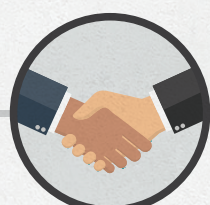
Познакомиться с членами УИК