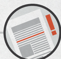
Проверить, что тебя внесли в реестр наблюдателей