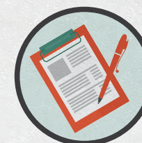
Каждый избиратель расписывается за бюллетень , а член комиссии делает запись в списке избирателей