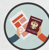
Избирателю выдается ОДИН* бюллетень при предъявлении документа**