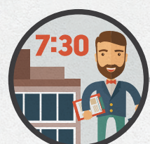
Прибыть на участок заранее