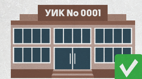
Номер избирательной комиссии

Что обязательно должно быть на избирательном участке?