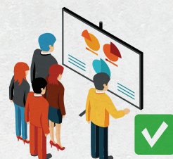
Стенд с информацией для избирателей (увеличенная форма протокола, образец заполнения бюллетеня, информационные материалы о партиях, никаких следов агитации!)