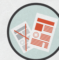
Избиратель может поменять испорченный бюллетень на новый