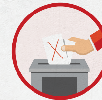
Кто-то пытается вбросить бюллетени