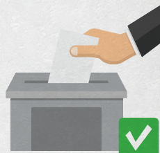
Ящики для голосования